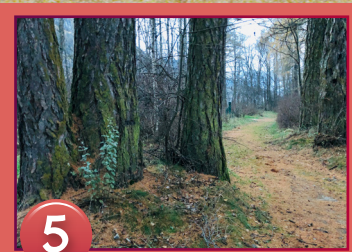
5 N47° 04.611' E010° 57.426'