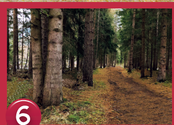
6 N47° 04.380' E010° 57.675'