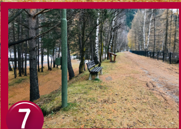
7 N47° 04.334' E010° 57.999'