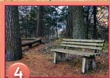
4 N47° 04.438' E010° 57.570'