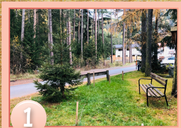
1 N47° 04.455' E010° 58.337'